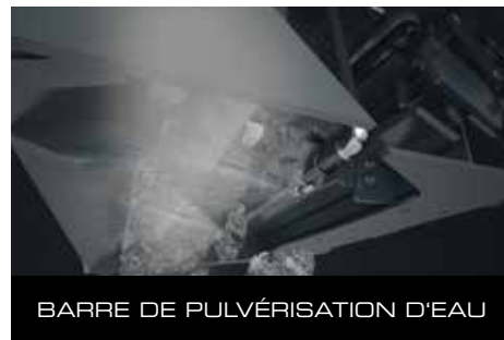
BARRE DE PULVÉRISATION D'EAU

Les équipements optionnels suivant sont disponibles: